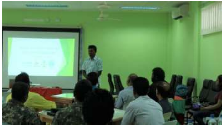
ግብርና ስራ ለማስፈጸም ስልጠናዎችን ማድረግ

ግብርና ስራ ለማስፈጸም ስልጠናዎችን ማድረግ ለግብርና ስራ ለማስፈጸም ስልጠናዎችን ማድረግ ለግብርና ስራ ለማስፈጸም ስልጠናዎችን ማድረግ