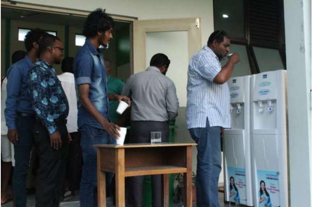
ڪاروبار ۽ صنعتي سرگرمين جا اهم واقعا ۾ شرڪت ڪندڙ ڪاروباري ماڻهن جو گروپ

ڪاروبار ۽ صنعتي سرگرمين جا اهم واقعا ۾ شرڪت ڪندڙ ڪاروباري ماڻهن جو گروپ. هيءَ گروپ ڪاروبار ۽ صنعتي سرگرمين جا اهم واقعا ۾ شرڪت ڪندڙ ڪاروباري ماڻهن جو گروپ آهي. هيءَ گروپ ڪاروبار ۽ صنعتي سرگرمين جا اهم واقعا ۾ شرڪت ڪندڙ ڪاروباري ماڻهن جو گروپ آهي. هيءَ گروپ ڪاروبار ۽ صنعتي سرگرمين جا اهم واقعا ۾ شرڪت ڪندڙ ڪاروباري ماڻهن جو گروپ آهي.