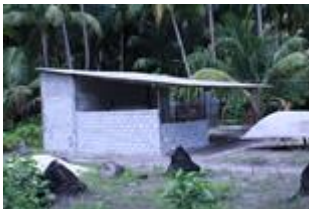
3 دَوسَرِيَّ ۛ ۛ ۛ

دَسَوَنَدَرْدَر ۲۰۰۰ رَا نَجَافِی ۳ دَر دَر اَحْمَد ۳ مَعْمُود سَر قَرْنَمُو فَرْهَاد.